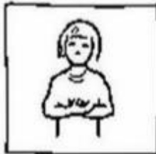
Geef ons heden ons dagelijks brood