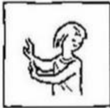
en breng ons niet in beproeving