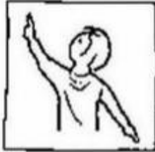
op aarde zoals in de hemel