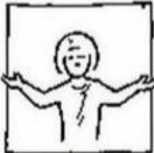
uw rijk kome