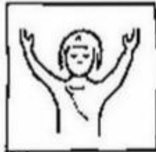
Onze Vader die in de hemel zijt