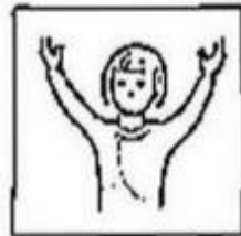
en de kracht en de eeuwigheid