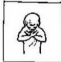
uw wil geschiede