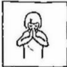
uw naam worde geheiligd