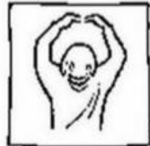
tot in eeuwigheid. Amen