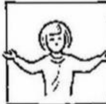
Want van u is het koninkrijk