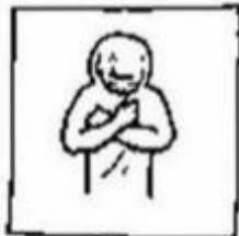
en vergeef ons onze schulden