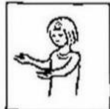
zoals ook wij vergeven aan onze schuldenaren