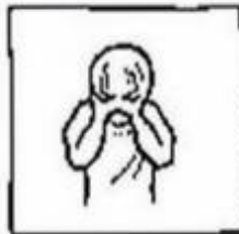
maar verlos ons van het kwade